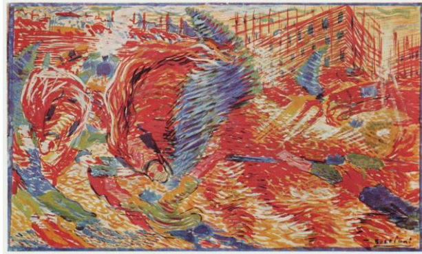
La città che sale , Umberto Boccioni

http://www.elarteporelarte.es/el-futurismo-italiano/