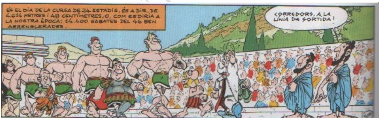
Astèrix i els Jocs Olímpics

Anys i segles després, quan l'imperi romà es va esquarterar, tothom va tornar a pensar pel seu compte i les mides van començar a variar i a diferenciar-se de país a país, de comarca a comarca.