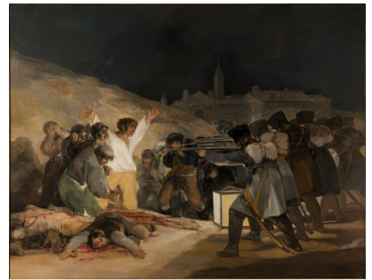
In ictu oculi , Juan de Valdés Leal (1672) El entierro del conde de Orgaz , El Greco (1588) El tres de mayo , Francisco de Goya (1814)

http://www.salvador-dali.org/cataleg_raonat/fitxa_obra.php?obra=499&inici=1940&fi=1946 ( El rostro de la guerra , Salvador Dalí, 1940)