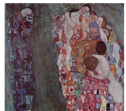
Lección de anatomía del Dr. Nicolaes Tulp , Rembrandt van Rijn (1632) La muerte de Sardanápalo , Delacroix (1827) La vida y la muerte , Gustav Klimt (1911)