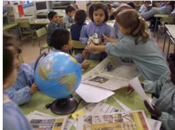
Com aprofitaven l'energia del sol