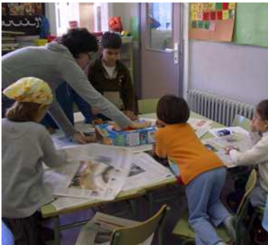
Construint un molí de vent

En parlar de les energies antigues, vam recórrer als avis i besavis que ens explicaven com vivien. Vam intentar organitzar la informació recollida a partir d'una línia del temps que comencés amb l'any que va néixer el besavi més antic i que acabés quan els nens i nenes van néixer, al 1998. A la tira numèrica hi vam anar posant els anys de naixement dels nostres avis i pares i alguns invents importants que ens havien anat explicant, com la bombeta.