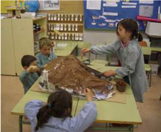
Construint el salt d'aigua