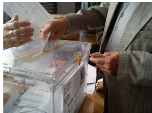
Fotografia de les votacions a les eleccions catalanes del 25 de novembre de 2012.

Francisco Franco, "Caudillo de España" (1939-1975)