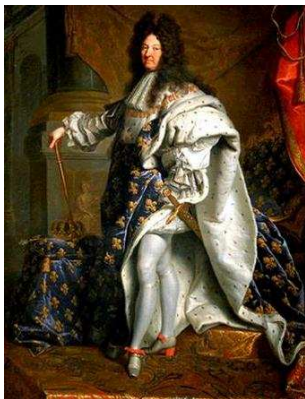
Retrat de Lluís XIV, pintat per Hyacinthe Rigaud, 1701

a) Relaciona cada fotografia amb el tipus d'estat que representen. (1p)