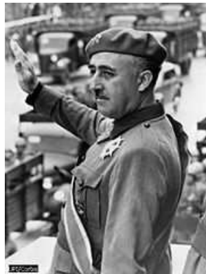
Fotografia de Franco presidint l'entrada de les seves tropes a una ciutat espanyola, aprox. 1939

Lluís XIV, rei de França (1643-1715) « L'Estat sóc jo »